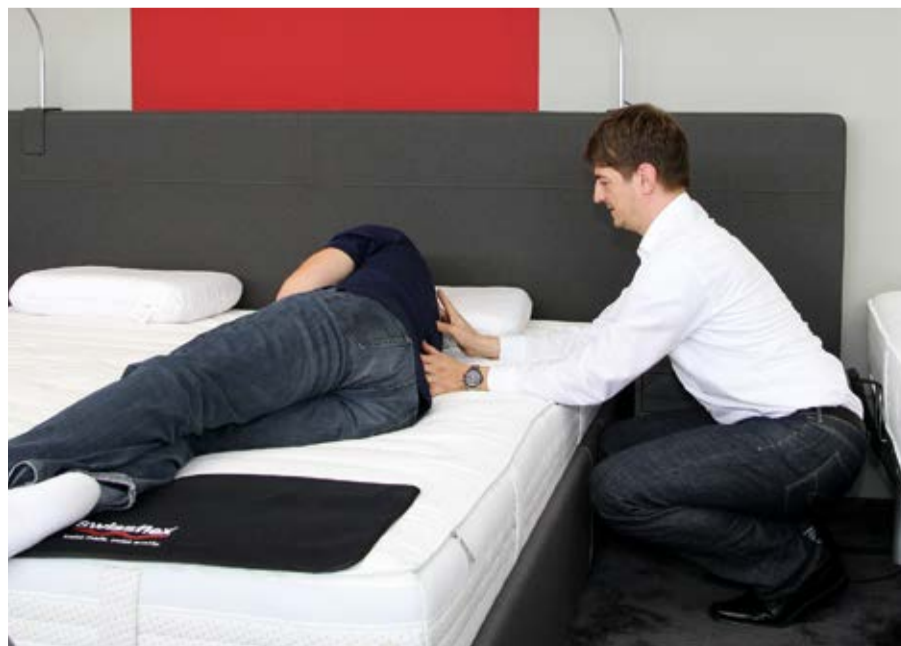
Eine ausgiebige Bedarfsanalyse, die markenunabhängige Beratung und zielgerichtetes Probeliegen bringen den Erfolg.

und Frauenbetten, Belüftungszonen, Seitenschläfermatratzen – das Bett und die richtige Matratze sind ein komplexes Thema. Betten-Gailing unterstützt Ihren Matratzenkauf bis zum 30. April 2014 mit einem attraktiven Gutschein (s. Seite 3): Lieferung der neuen Matratze und die umweltgerechte Entsorgung Ihrer alten Unterlage sind inklusive!