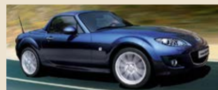
In Kooperation mit Mazda Klein in Bietigheim-Bissingen www.klein.mazda-autobaus.de

Unter allen richtigen Einsendungen verlosen wir den Kultroadster MX-5 für ein Wochenende (Fr. – Mo., 500 Kilometer inklusive)