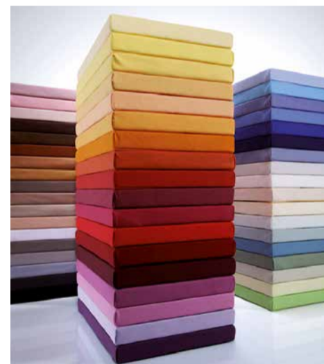
Unser bewährtes Bella Donna Jersey in 54 Farben ab 49,95 €